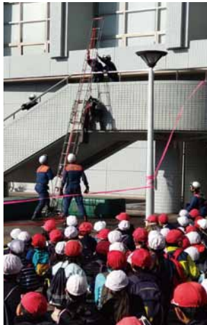
本番さながらの消火、救助訓練が行われました。

周南市では毎年11月の第3日曜日に「市民総合防災訓練」をしています。今年も周陽地区を中心に訓練が行われました。 「大雨の中、最大震度5強の地震が発生した」という想定でスタート。防災無線とラジオから避難を指示する放送が流れると、周陽地区の小中学生と住民が、家から避難場所に指定されたキリンビバレッジ総合スポーツセンターへ、一斉に避難しました。 会場では、消防・海保の連携救助訓練が行われ、自衛隊の災害派遣車両の体験乗車、料飲組合による炊き出しなど、30近くの体験・展示ブースが並びました。